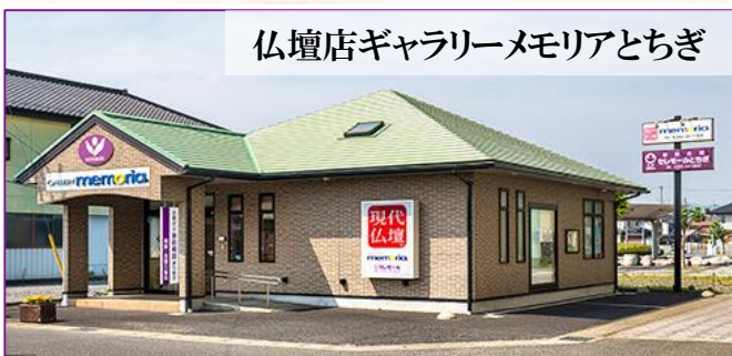
仏壇店ギャラリーメモリアとちぎ