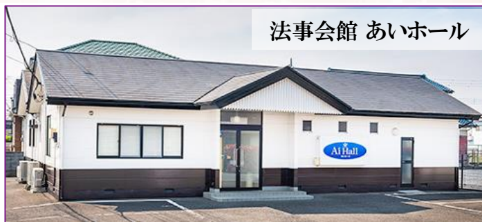
法事会館 あいホール